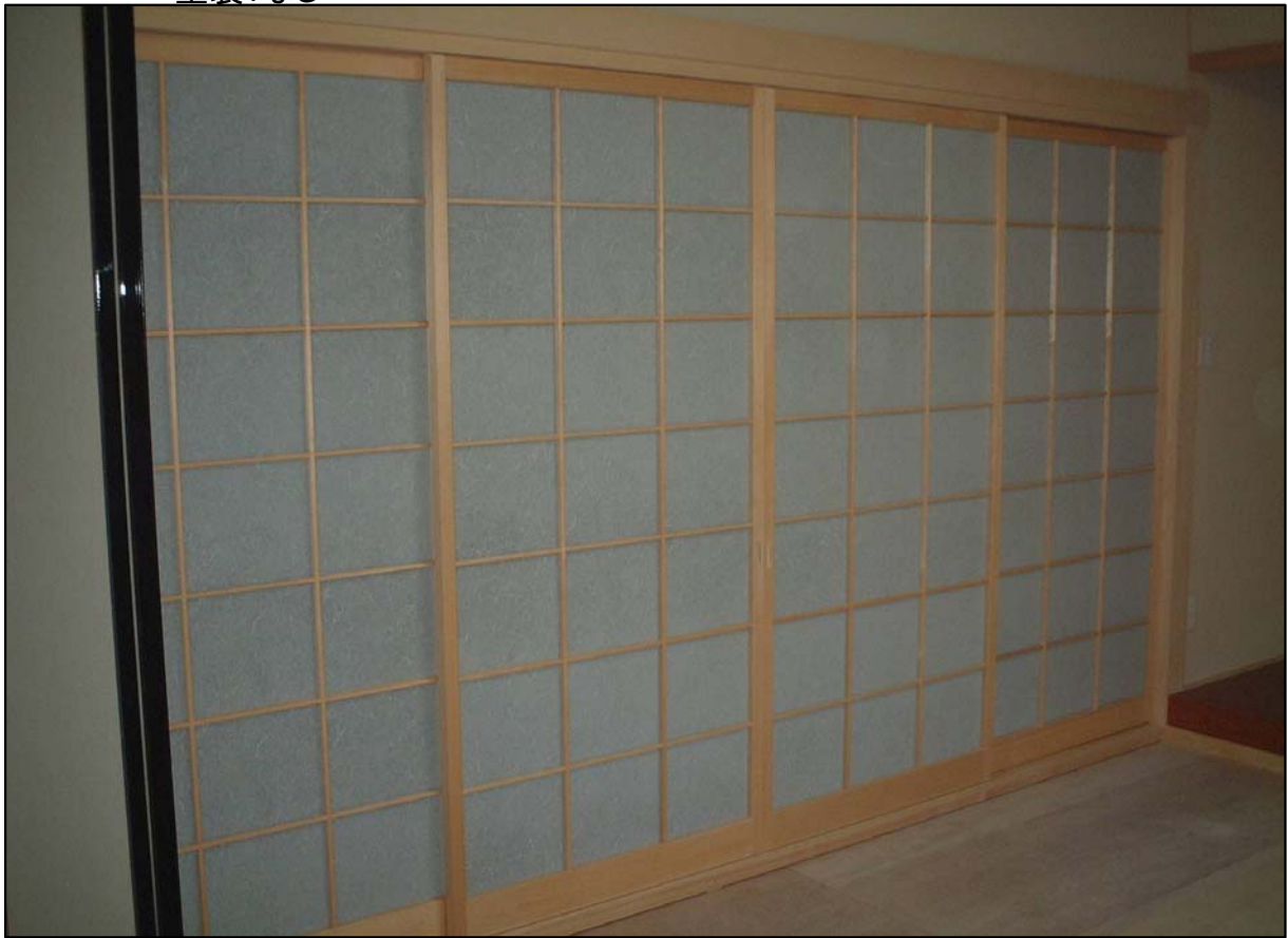
框格子ワーロン戸 4本引き違い 材質:スプールス 塗装:なし