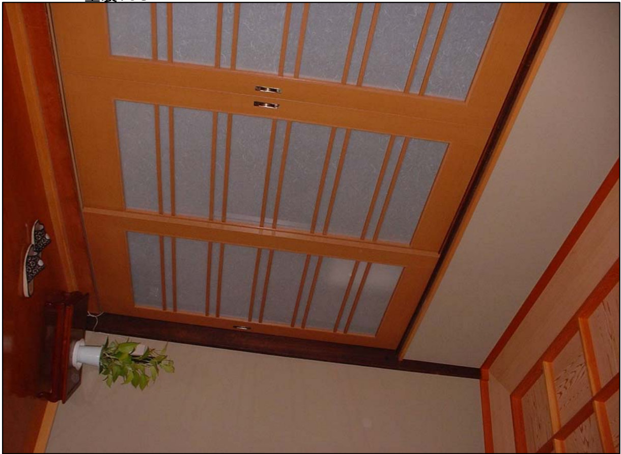
框格子ワーロン戸 引き違い 材質:スプールス 塗装:OS