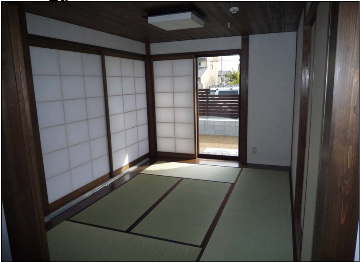
吹き寄せ幅広内障子 (可動) 材質:スプールス