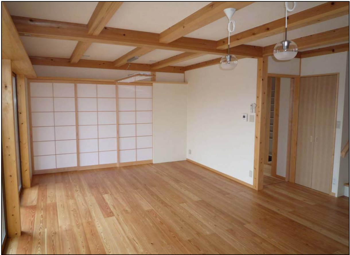
荒間内障子 材質:スプールス