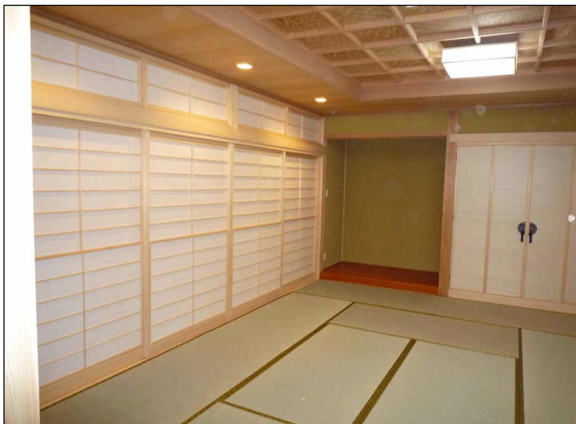
障子 飾り組子付 材質:スプールス