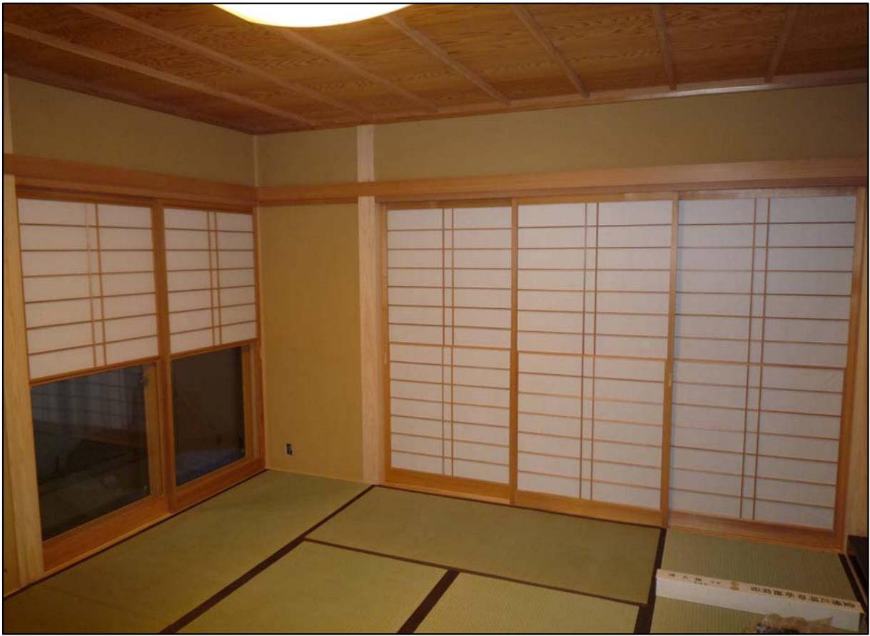
幅広吹き寄せ障子 材質:杉