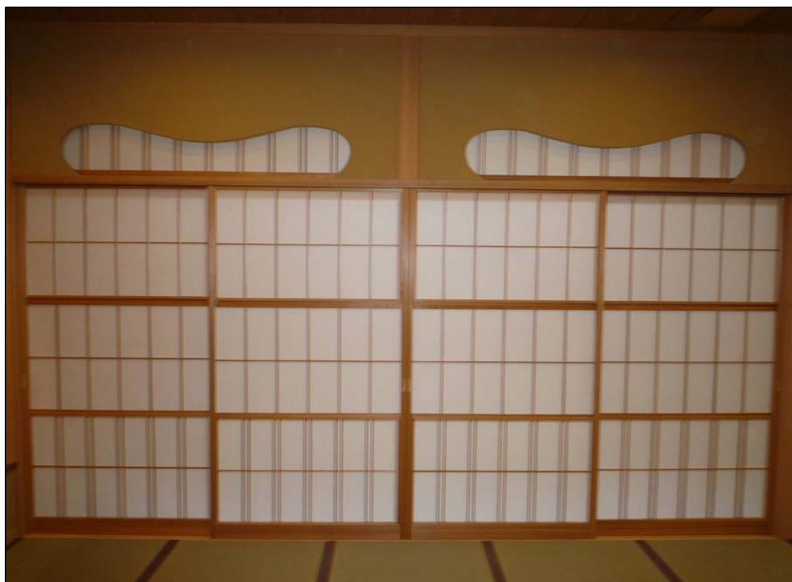
上下雪見障子+ランマ障子 材質:杉