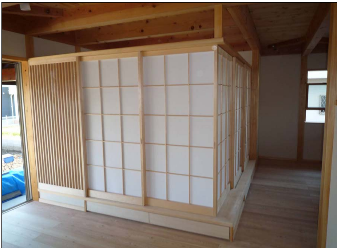
荒間障子2本引き込み×2 材質:スプールス 塗装:オスモ塗装